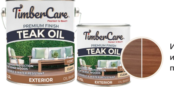
Идеально для защиты и восстановления плотных пород дерева